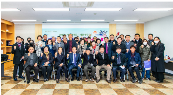
강동동 새해 현장토크(23.01.05)