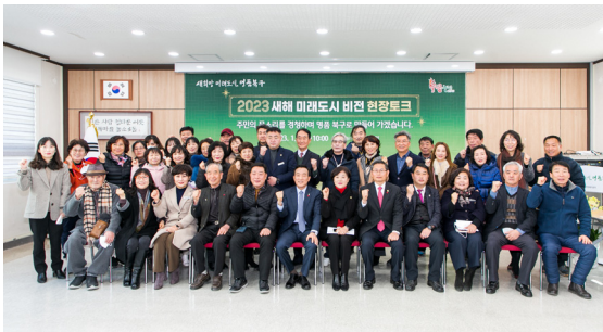
농소3동 새해 현장토크(23.01.04)