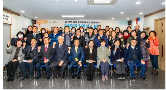
농소2동 새해 현장토크(23.01.03)