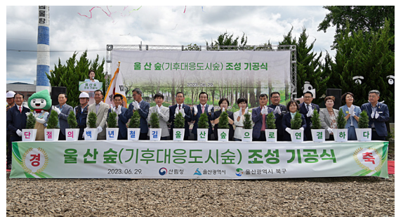
울산숲 조성사업 기공식(23.06.29)