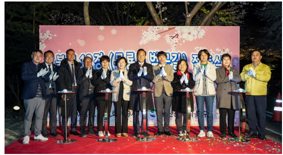
구국도31호 벚꽃길 점등식(23.03.28)