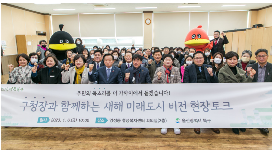
양정동 새해 현장토크(23.01.06)