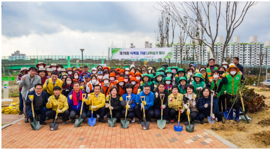
제78회 식목일기념 나무심기(23.03.15)