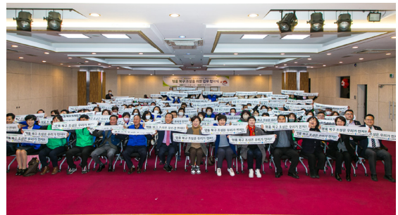
국민운동단체 명품복구조성 협약식 (23.02.20)