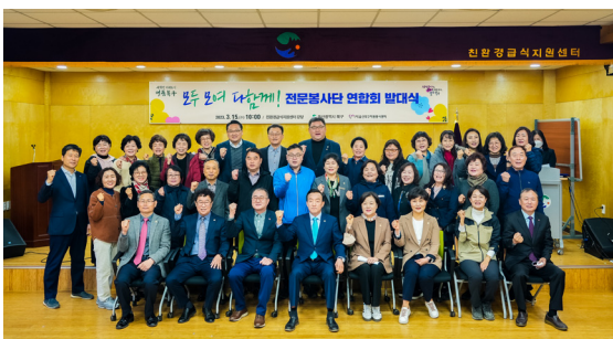
다함께 전문봉사단 발대식(23.03.15)