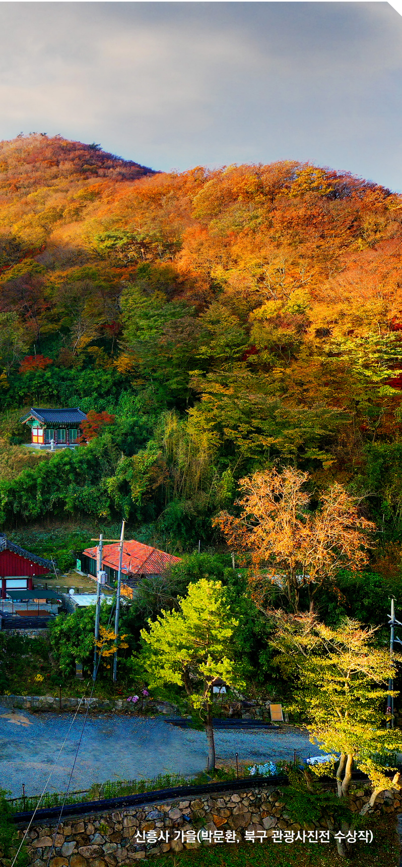
신흥사 가을(박문환, 북구 관광사진전 수상작)