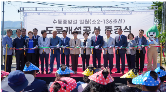
수동중앙길 도로개설 준공식(23.05.31)