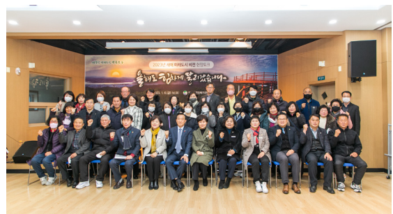
염포동 새해 현장토크(23.01.06)