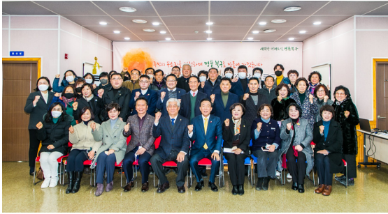
농소1동 새해 현장토크(23.01.03)