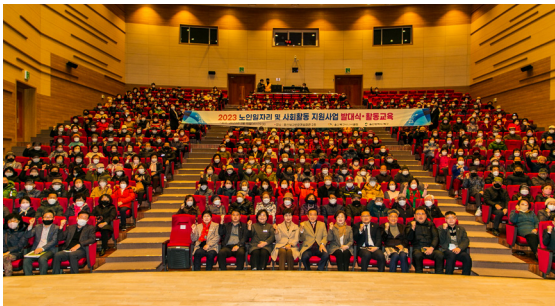
노인일자리 사회활동 지원사업 발대식 (23.02.15)