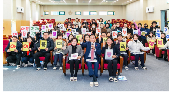
아동권리존중 프로젝트 성과보고회 (23.01.30)