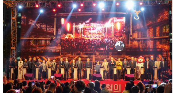
제19회 쇠부리축제 개최식(23.05.12)