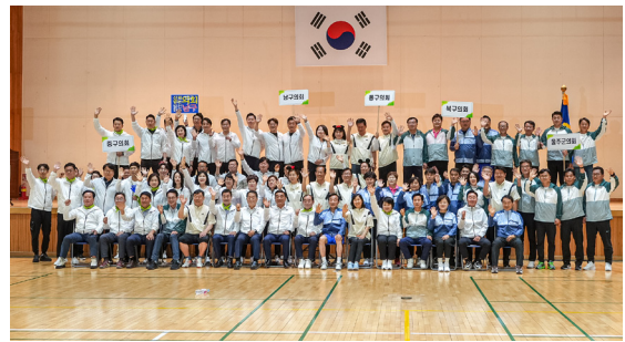
구군의회 선출직 체육대회(23.06.05)