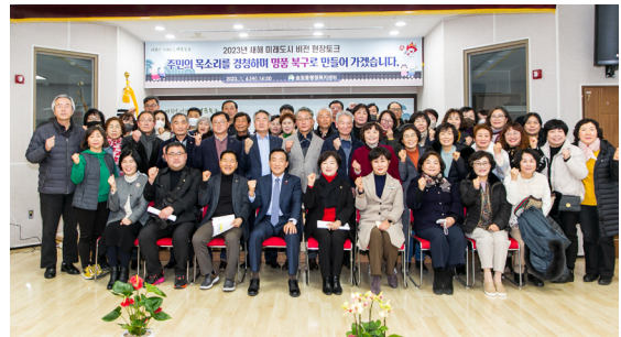
송정동 새해 현장토크(23.01.04)