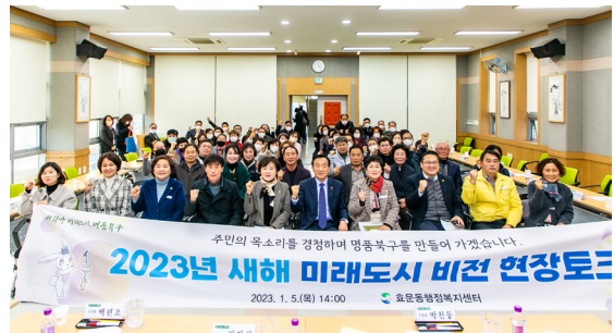
효문동 새해 현장토크(23.01.05)