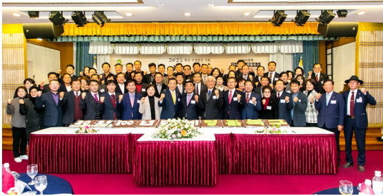
2023년 구정발전 신년인사회(23.01.09)