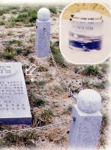
Time Capsule (OPEN 2101)