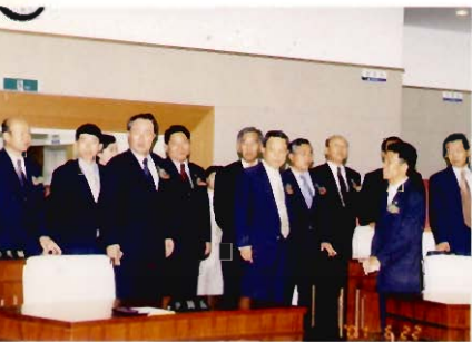
본회의장 방문(개청식 내빈) (Visit to plenary session hall, Guest of the opening ceremony)

집행기관이 적법하고 합리적인 행정을 집행하고 있는가를 감시하고 확인하기 위해 보고, 승인, 질문, 행정사무감사·조사하는 역할