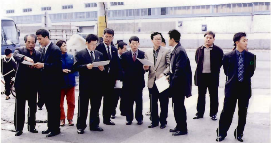
현장확인활동 광경 (View of activities on the spot)