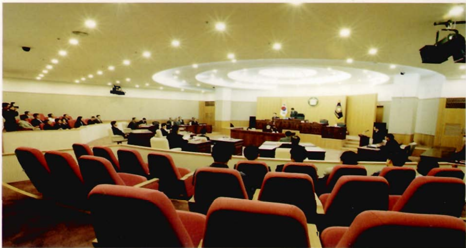
본회의장 회의 광경 (Conference view of plenary session hall)