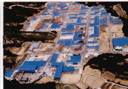
달천농공단지 (Dalcheon Agriculture-Industry Complex)