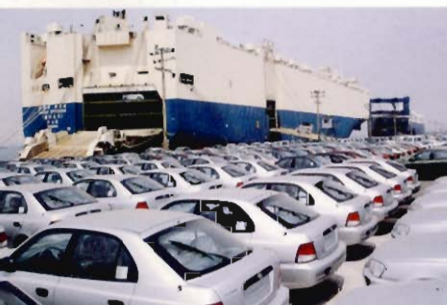
현대자동차(주) 선적장 (Shipment port in Hyundai Motor Company)

The role of report, approval, question, inspection the administrative affairs to certify for lawful and reasonable execution.