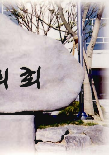
Memorial Stone of the gate