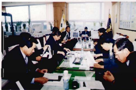
간담회 광경(의장실) (A round-table conference view)