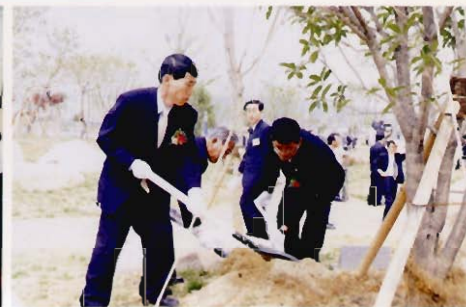
의장 기념식수(개청식) (Chairman's tree planting for commemoration)