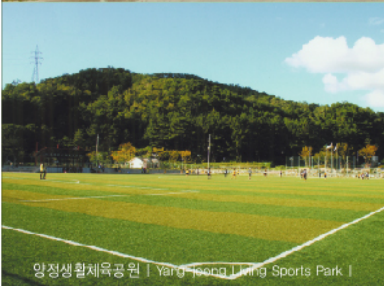
양정생활체육공원 | Yang Jeong Living Sports Park |