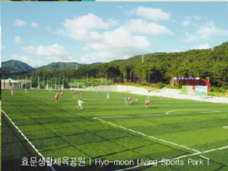
효문생활체육공원 | Hyo-moon Living Sports Park |