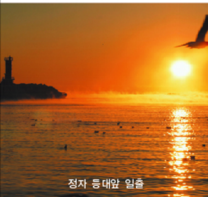
정자 등대앞 일출

The role of highest legislative organ inspecting and deciding important facts such as resident's duty for the autonomy, making regulations, operating bodies finally.