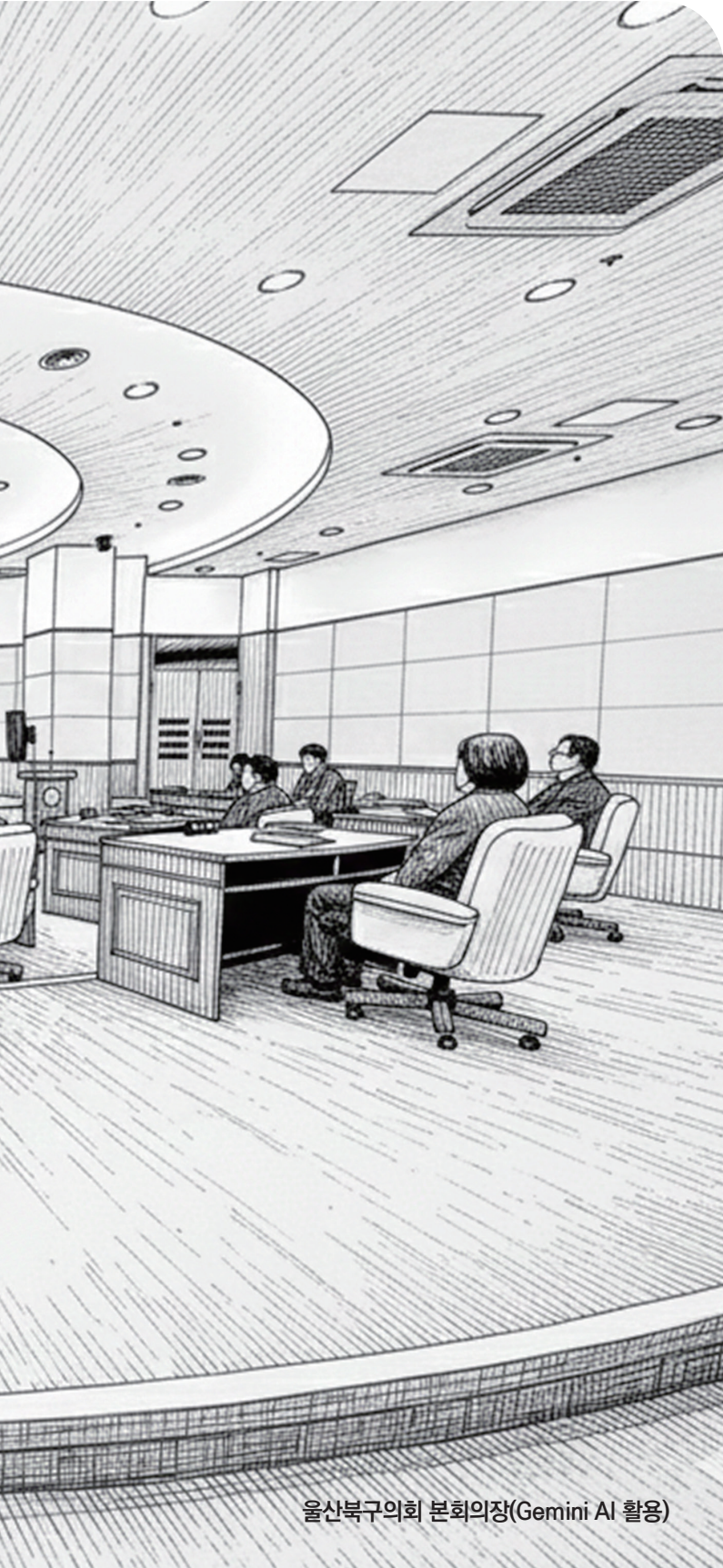
울산북구의회 본회의장(Gemini AI 활용)