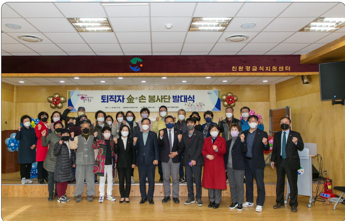
퇴직자 금손봉사단 발대식 (22.03.28)