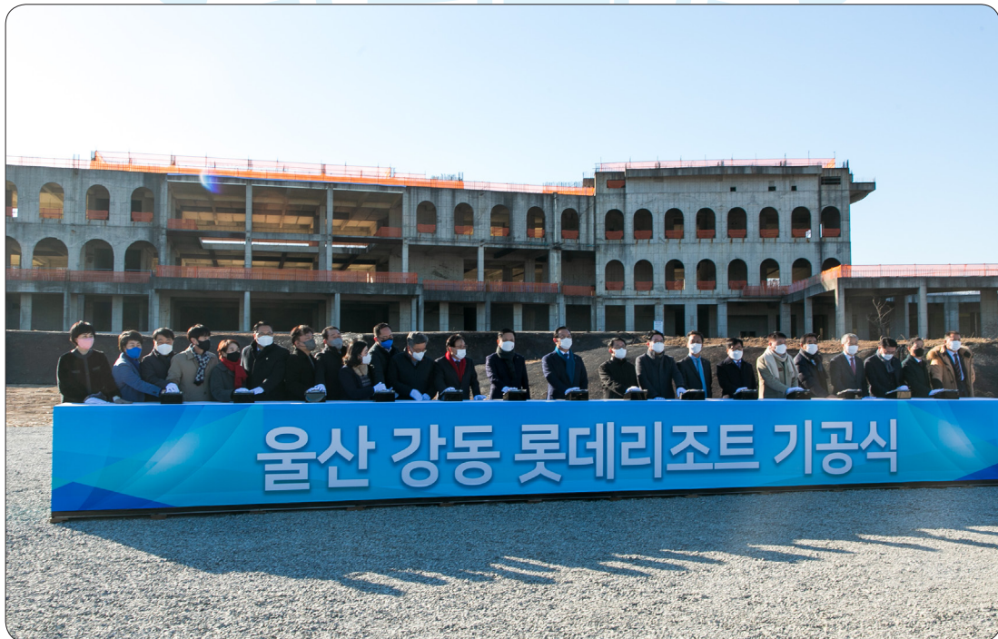
강동 롯데리조트 기공식 (22.01.18)