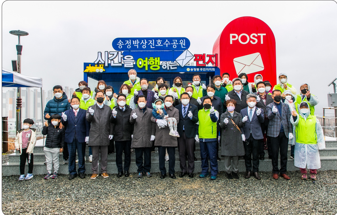
송정호수공원 우체통 전광판 오픈식 (22.03.19)