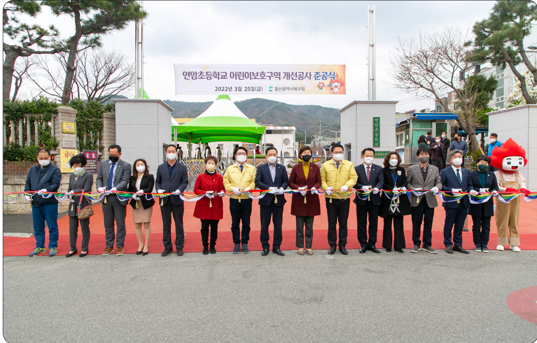
연암초 어린이보호구역 개선공사 준공식 (22.03.25)