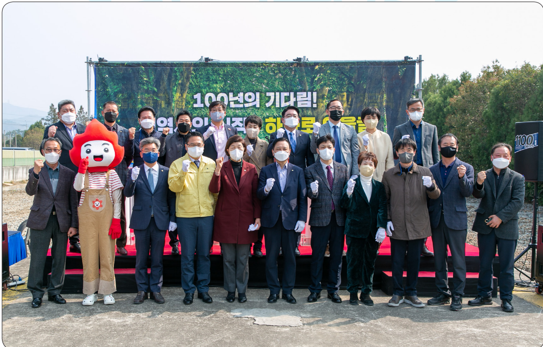
철도 유휴부지 활용사업 협약식 (22.03.24)