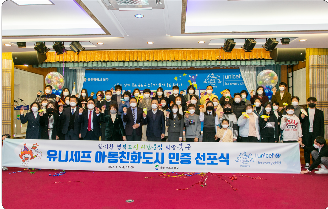
유니세프 아동친화도시 인증 선포식 (22.01.05)