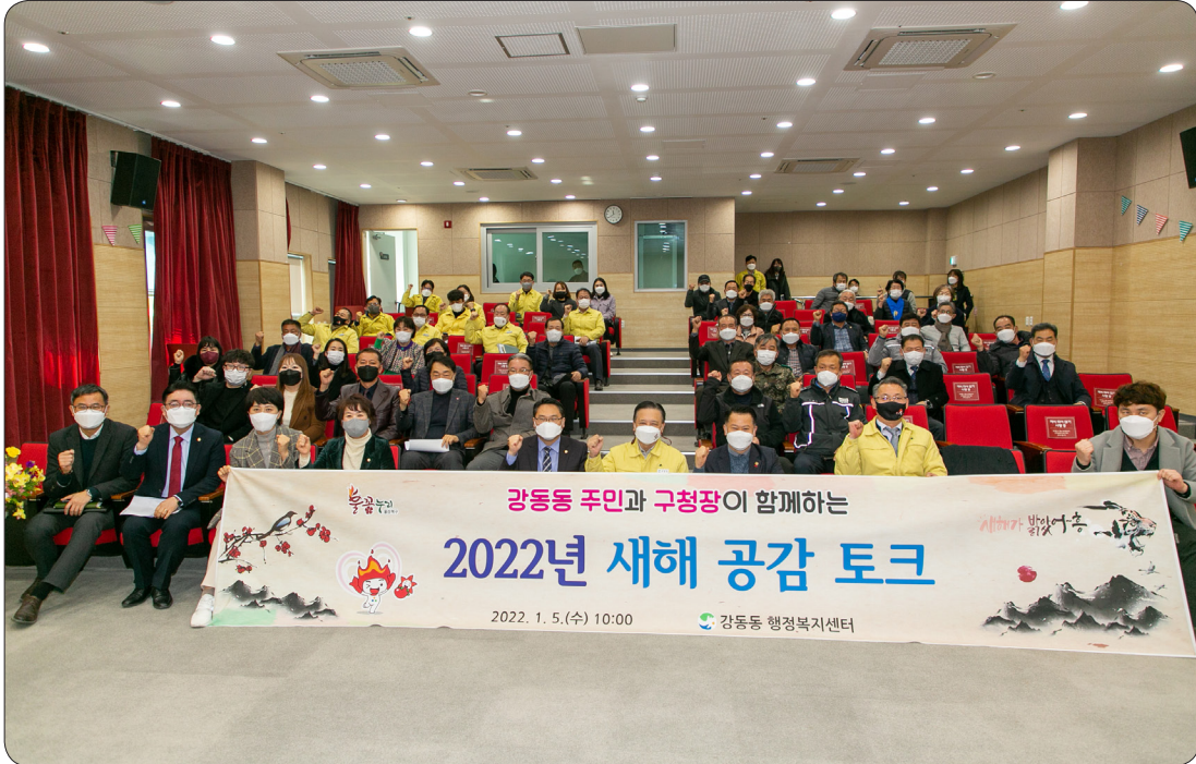
강동동 새해공감토크 (22.01.05)