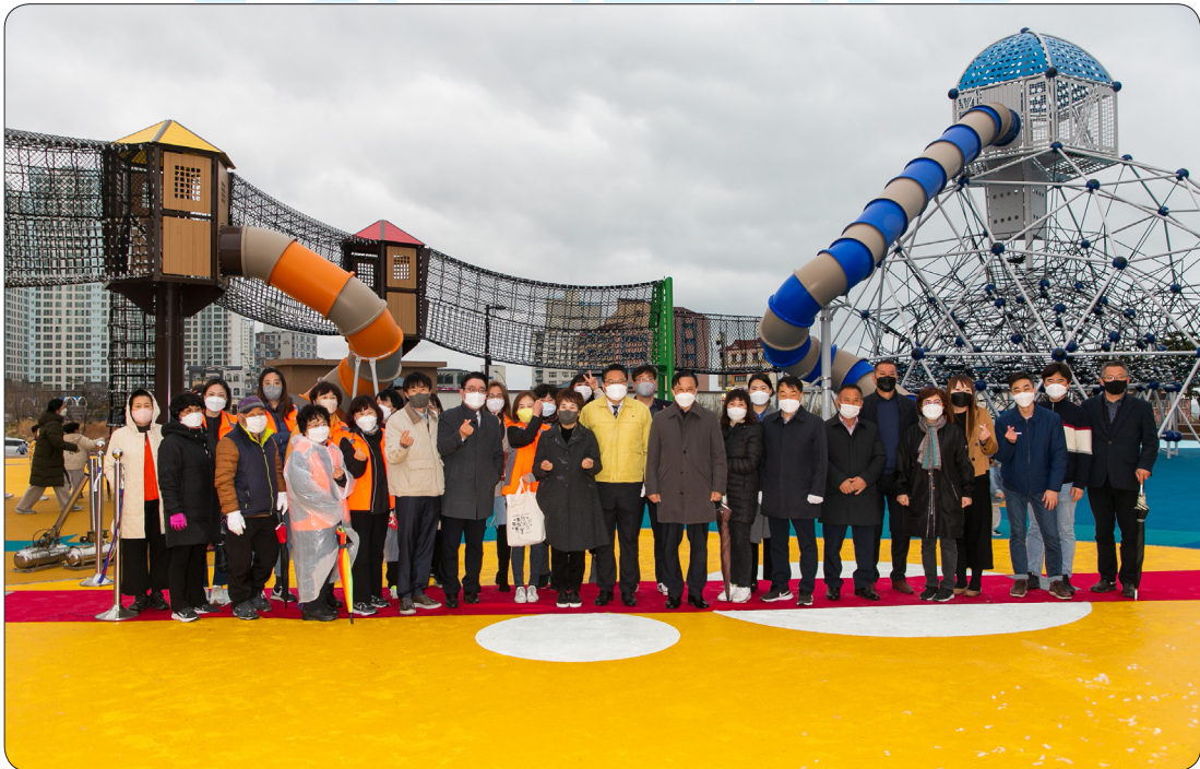
강동중앙공원 놀이시설 준공식 (22.03.31)