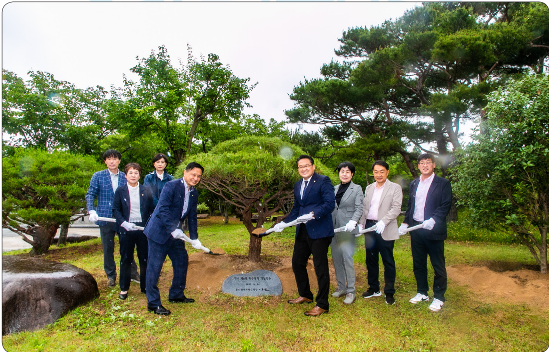
7대의원 기념식수 (22.06.14)