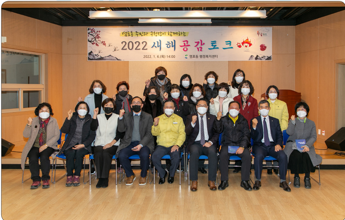
염포동 새해공감토크 (22.01.06)