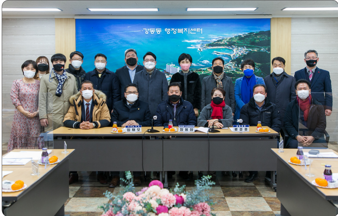
주민자치협의회 정기총회 (22.01.18)