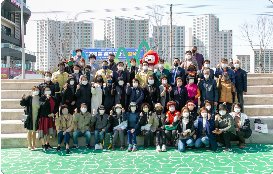
매곡천 수변경관 조형물 준공식 (22.03.29)