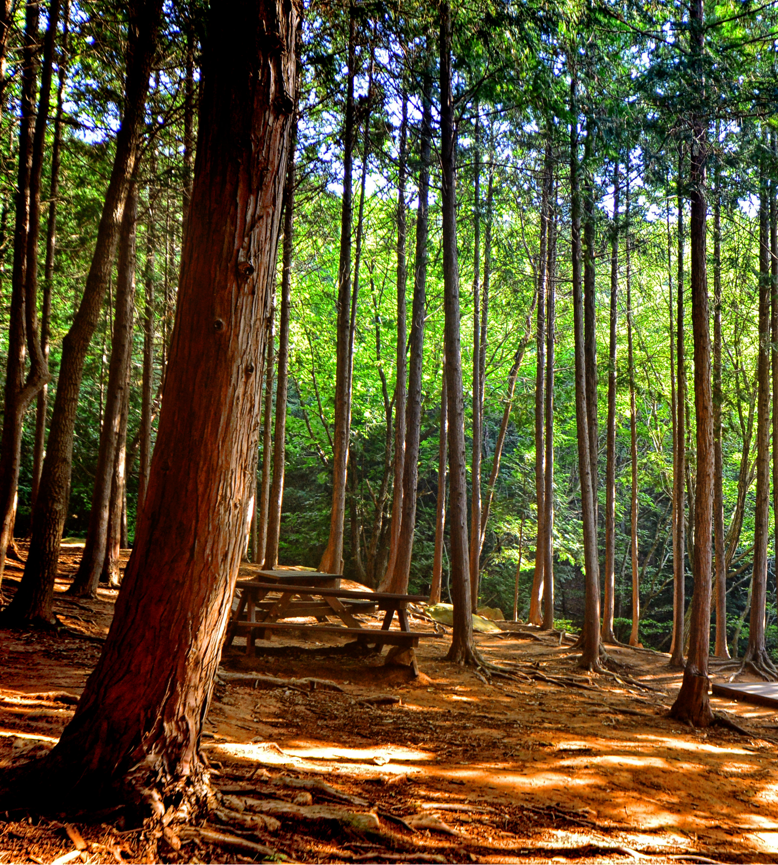
천마산 편백숲(고수경, 북구 관광사진전 수상작)