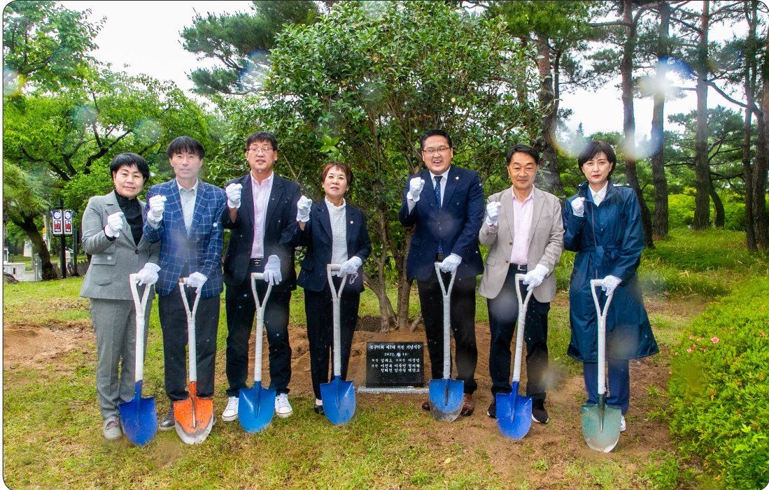
7대의원 기념식수 (22.06.14)