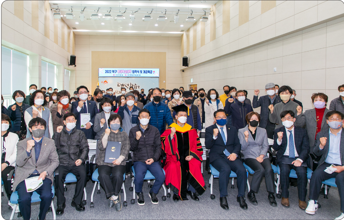
평생학습대학 개강식 (22.03.22)