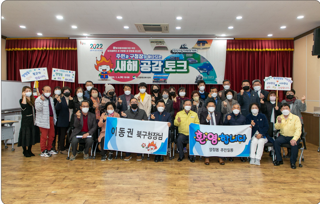
양정동 새해공감토크 (22.01.06)