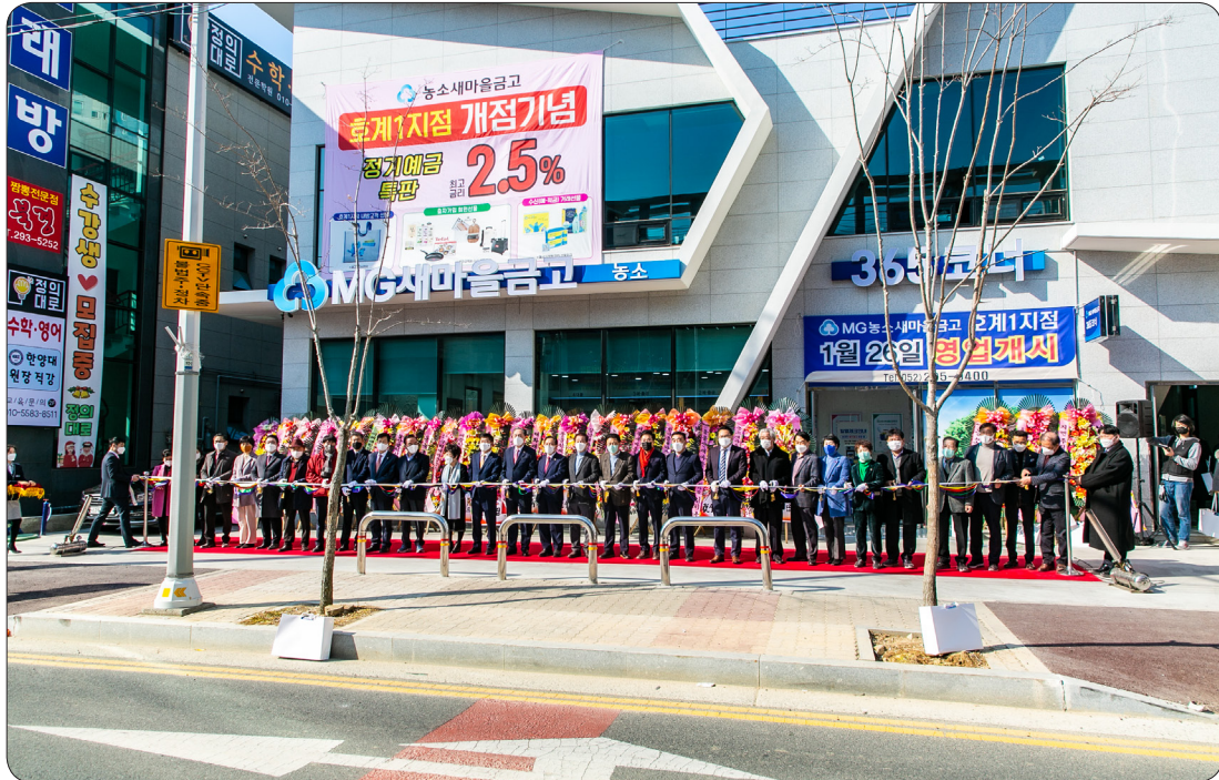
농소새마을금고 호계1지점 개점식 (22.02.11)