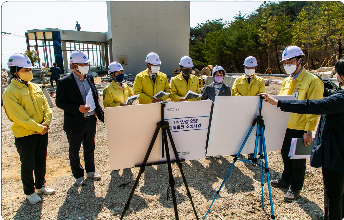
200회 임시회 현장방문 (22.04.04)