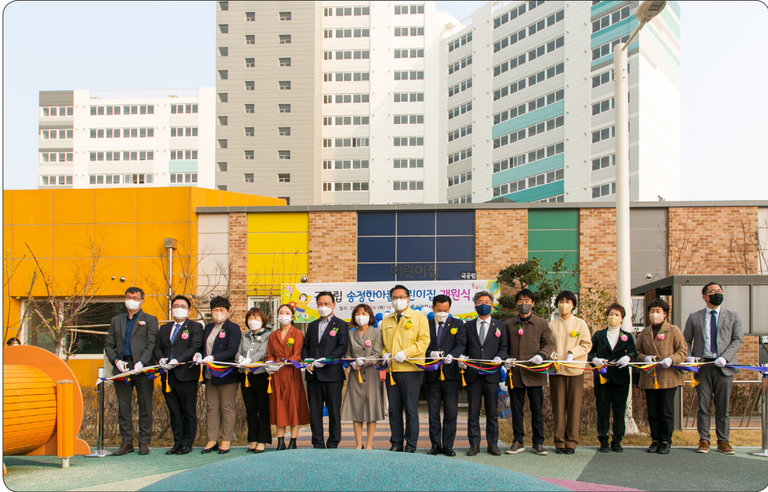
송정하아름어린이집 개소식 (22.03.24)