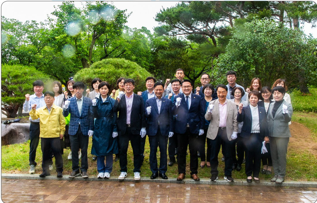
7대의원 기념식수 (22.06.14)