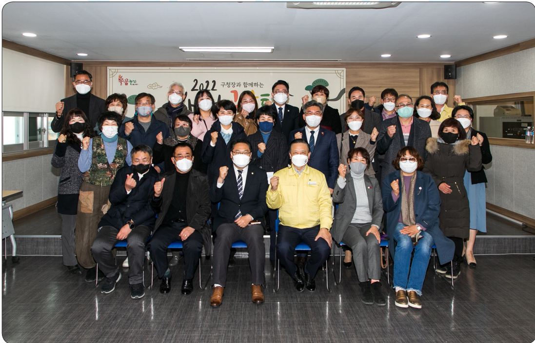
농소2동 새해공감토크 (22.01.03)