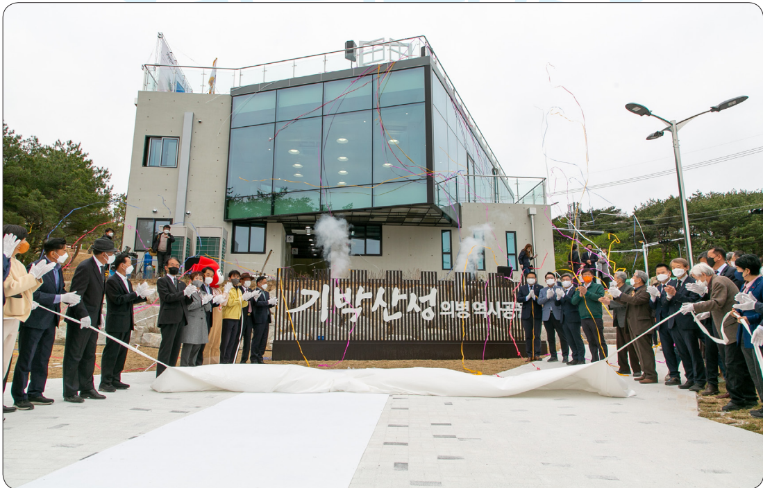
기박산성 의병역사공원 준공식 & 추모제 (22.04.21)