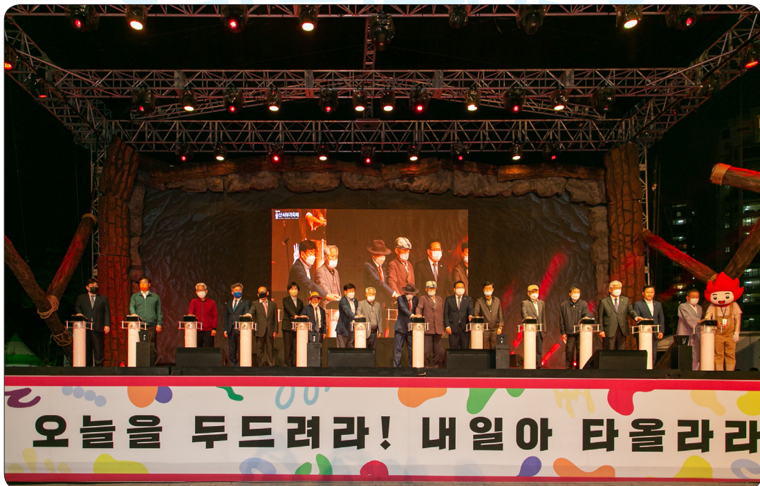
18회 쇠부리축제 개막식 (22.05.13)