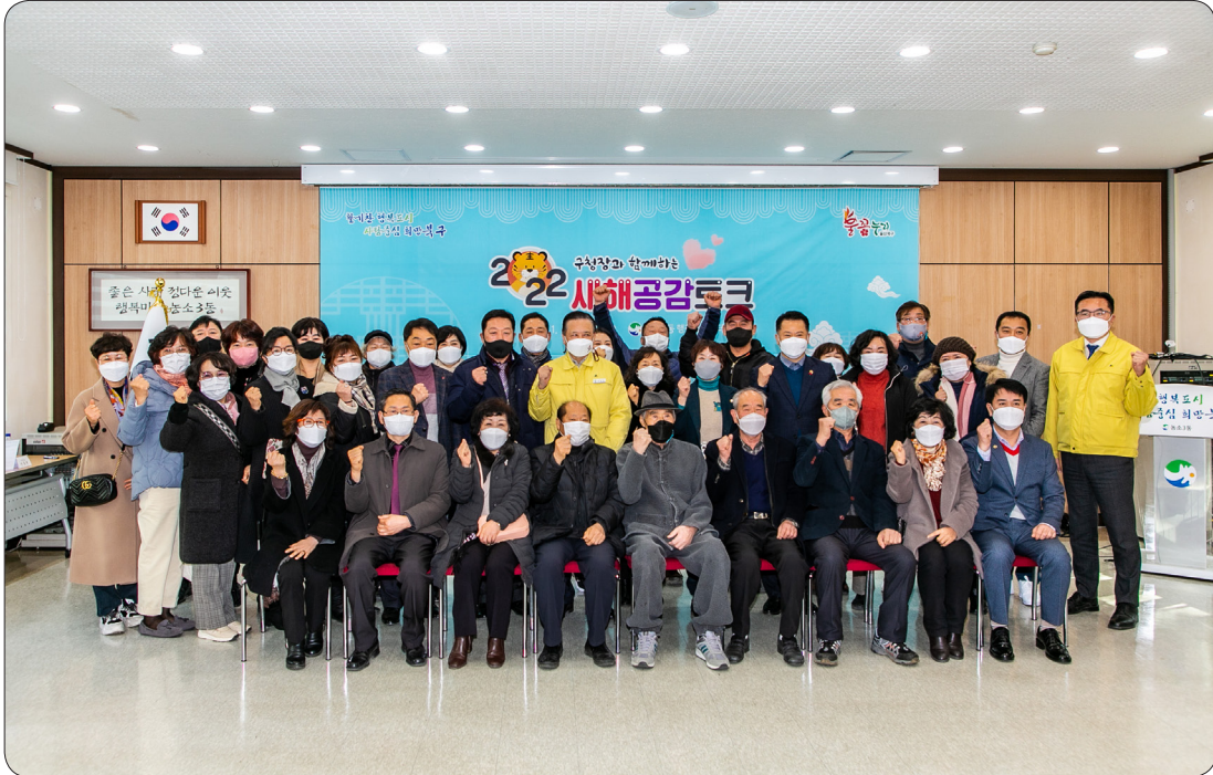
농소3동 새해공감토크 (22.01.04)