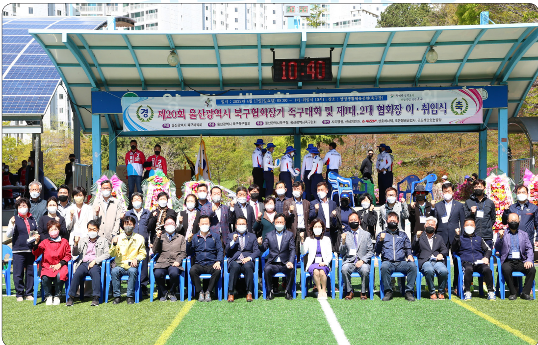
제2대 북구축구협회 회장 이취임식 (22.04.17)