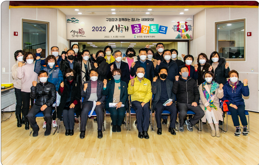
송정동 새해공감토크 (22.01.04)