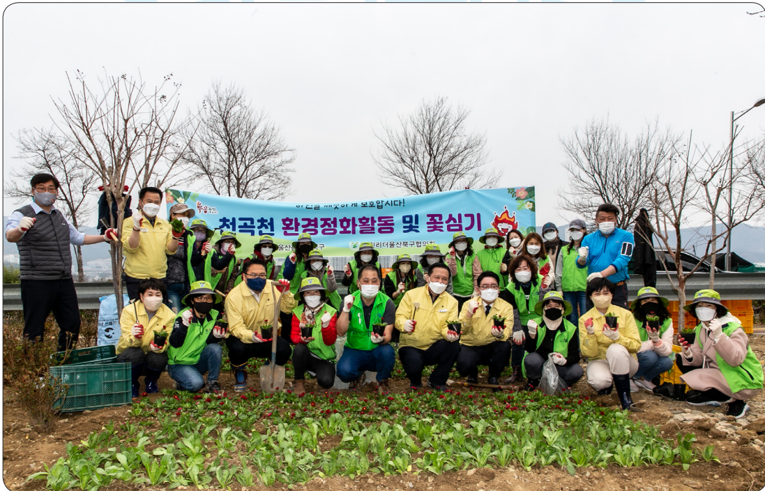
그린리더 천곡천 환경정화 활동 및 꽃심기 (22.03.23)