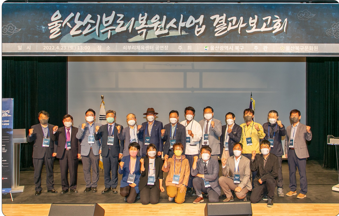
쇠부리복원실험 결과보고회 (22.04.23)