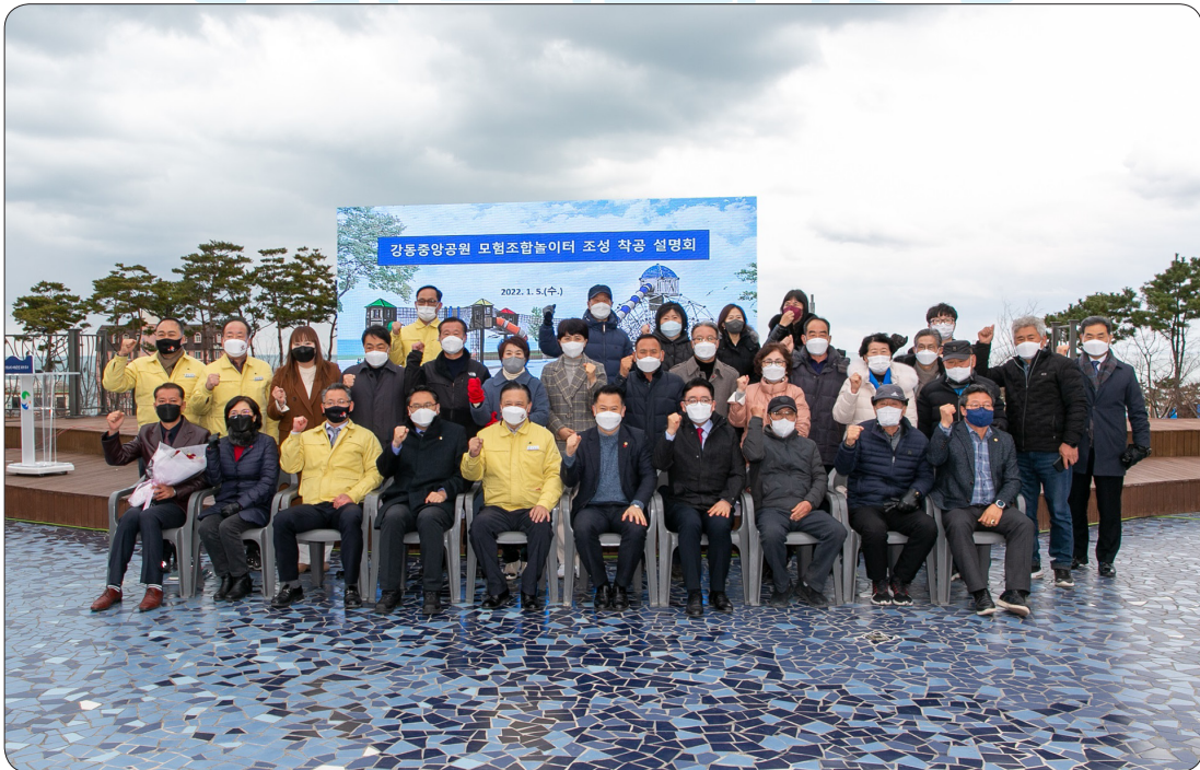
강동중앙공원 어린이 놀이터 기공식 (22.01.05)