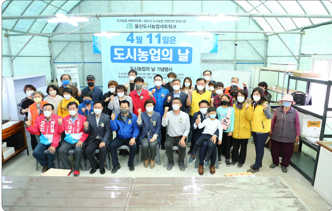
도시농업의날 기념식 (22.04.10)