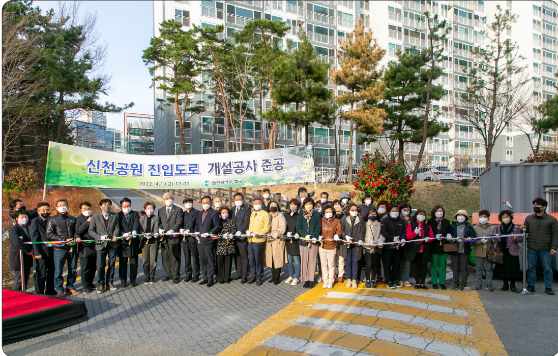
신천근린공원 진입도로 준공식 (22.04.01)