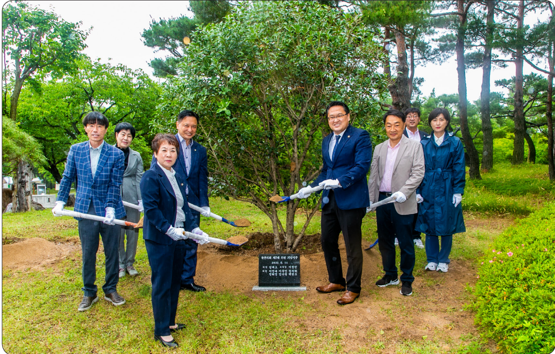
7대의원 기념식수 (22.06.14)