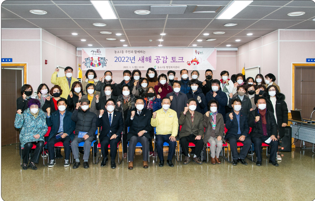
농소1동 새해공감토크 (22.01.03)