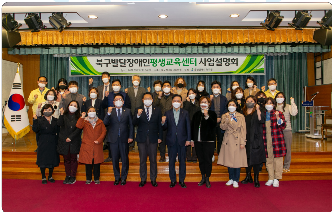
발달장애인평생교육센터 사업설명회 (22.03.21)