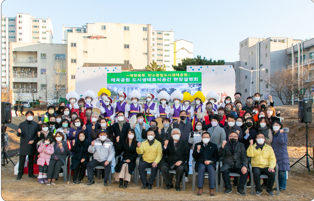
매곡공원 도시생태휴식공간 설명회 (22.01.07)