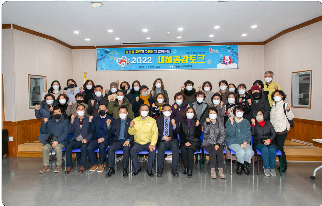
효문동 새해공감토크 (22.01.05)