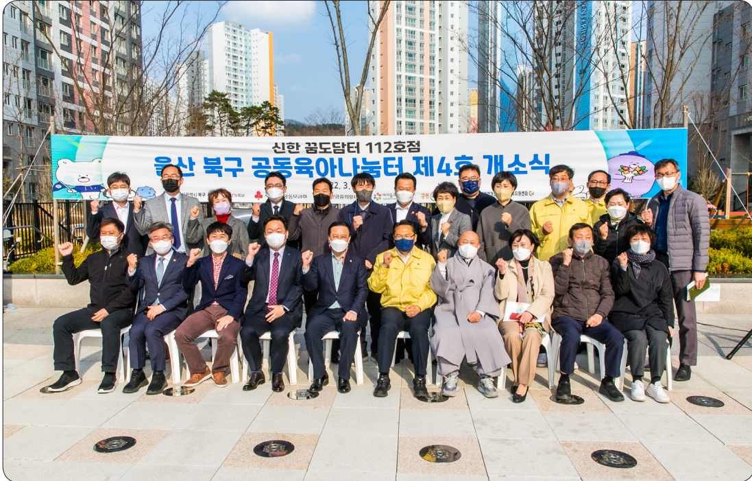
공동육아나눔터 4호점 개소식 (22.03.22)