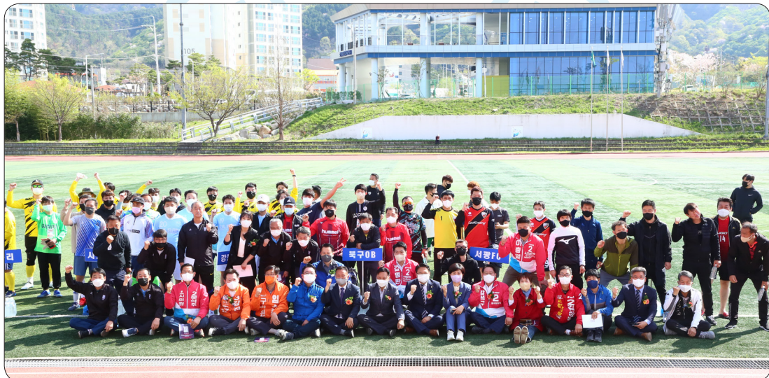
북구축구협회장배 축구대회 개회식 (22.04.10)