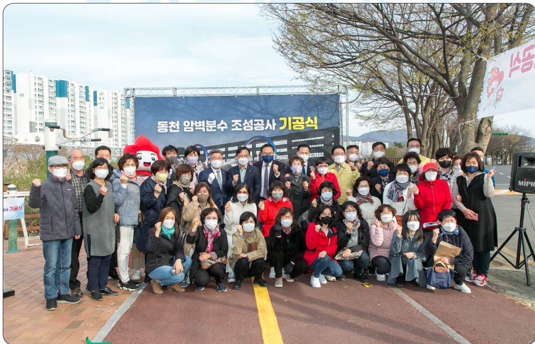
동천 암벽분수 조성사업 기공식 (22.03.28)