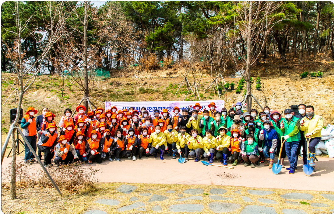
신천공원 수국심기 행사 (22.03.22)