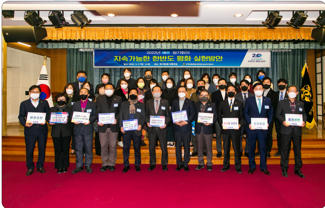
민주평통 1분기 정기회의 (22.03.03)