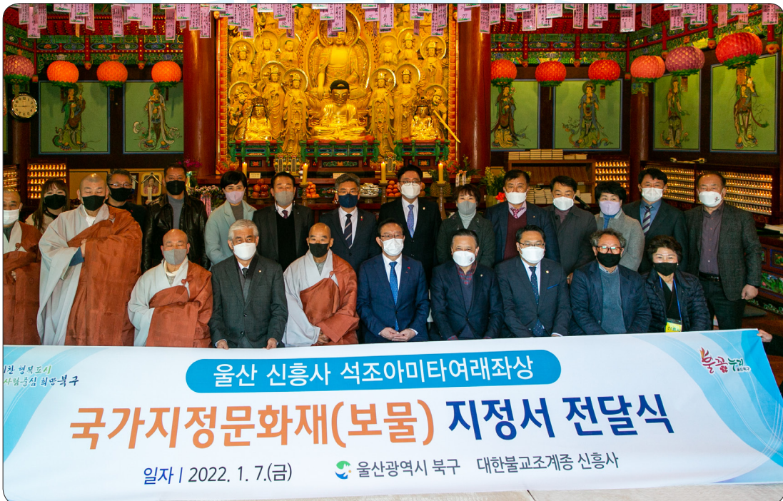
신흥사 국가문화재 지정서 전달식 (22.01.07)