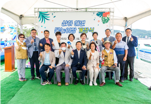
강동 물놀이장 개장식(22.07.23)