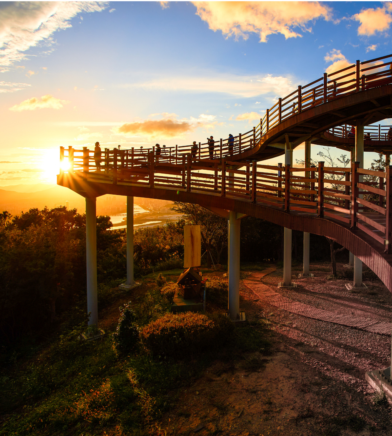
염포전망대의 일몰(정성주, 북구 관광사진전 수상작)