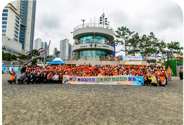
북구통장회 강동해변 정화활동 격려(22.07.12)