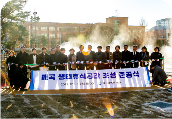
매곡공원 조성사업 준공식(22.12.08)