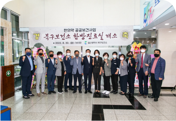
북구보건소 한방진료실 제막식(22.08.30)