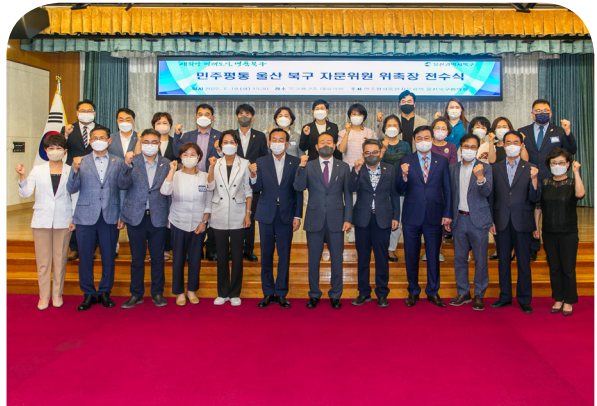
민주평통 자문위원 위촉(22.07.19)