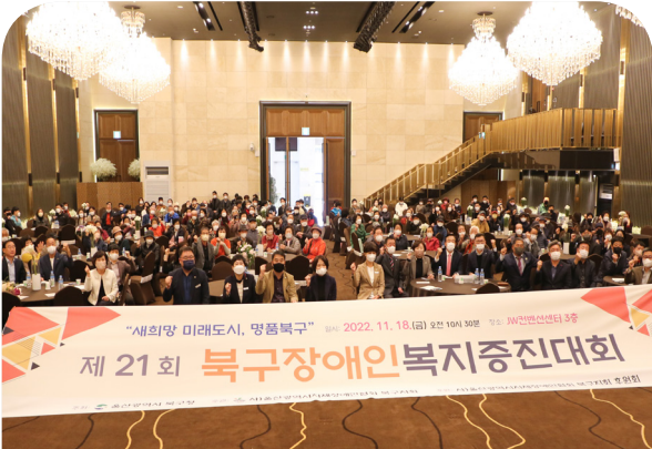
제21회 북구장애인 복지증진대회(22.11.18)