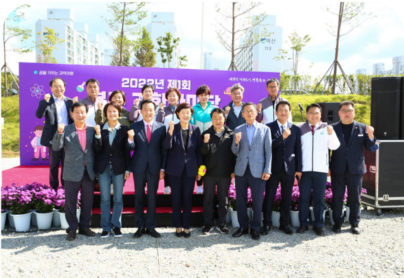
제1회 꿈을 키우는 과학한마당(22.10.08)