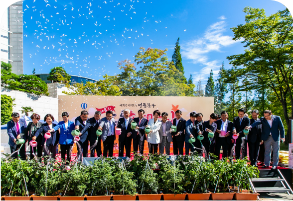
2022년 북구 농도한마당(22.09.24)