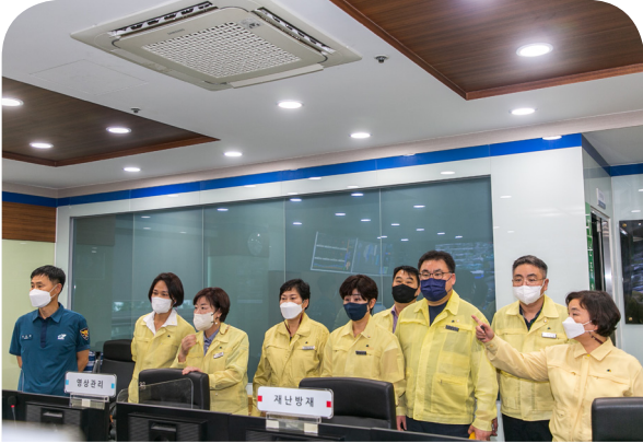
북구의회, CCTV 관제센터 방문(22.08.23)