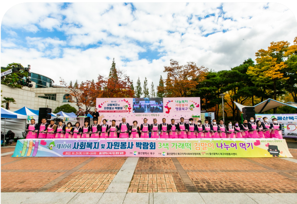
제10회 사회복지 및 자원봉사 박람회(22.10.29)