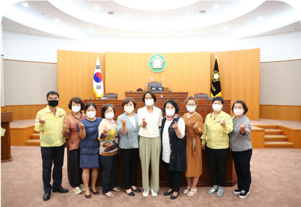
의회를 사랑하는 사람들 울산북구지회와의 간담회 (22.08.09)