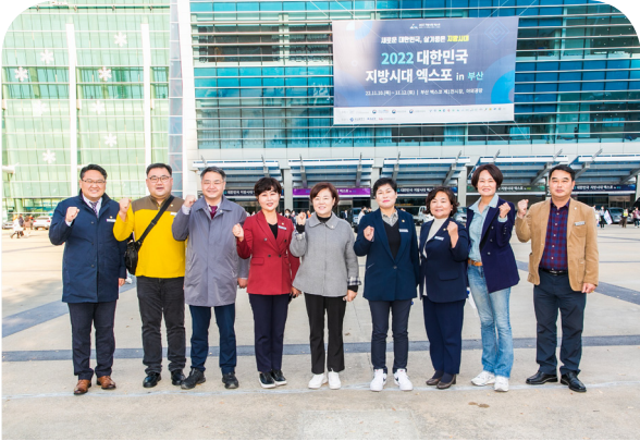
대한민국 지방자치 경영혁신 엑스포(22.11.10)