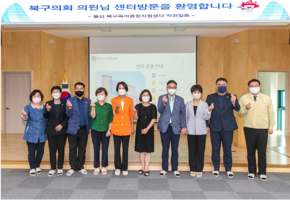
204회 임시회 현장방문(22.07.21)